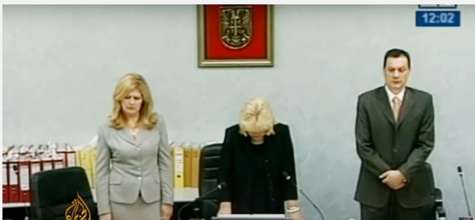
Iz snimka izricanja presude izvršiocima atentata na predsednika Vlade Republike Srbije

organa u čijoj je to nadležnosti, nije emitovano / prikazano u elektronskim medijima sa nacionalnom frekvencijom. Praktično jedini izuzetak je suđenje izvršiocima atentata na predsednika Vlade Republike Srbije.